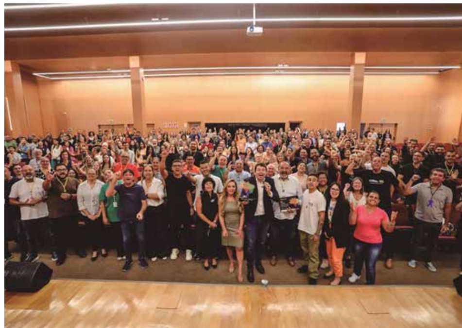
Reconhecimento nacional destaca município como referência em inovação, tecnologia e gestão pública eficiente

A conquista reforça o compromisso de Santana de Parnaíba com a inovação na gestão pública, consolidando o município como referência nacional em desenvolvimento urbano inteligente e sustentável. O reconhecimento também evidencia o trabalho contínuo da administração em investir em tecnologia e planejamento estratégico para oferecer serviços mais eficientes e melhorar a vida da população.